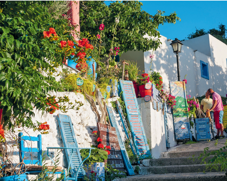
Op het trapsteegje naar de kerk van Ziá kom je langs Café 'Nerómilos – Watermill'. Een pauze hier is niet alleen de moeite waard vanwege de sfeer, maar ook om van het fraaie uitzicht over de kust en over de zee tot aan Turkije te genieten.

Bus: ma.-za. 4 x dag, van Kos-stad naar Ziá tussen 7 en 18.30 uur, terug gaat er nog een bus om 21.15 uur, ritprijs € 2,10.