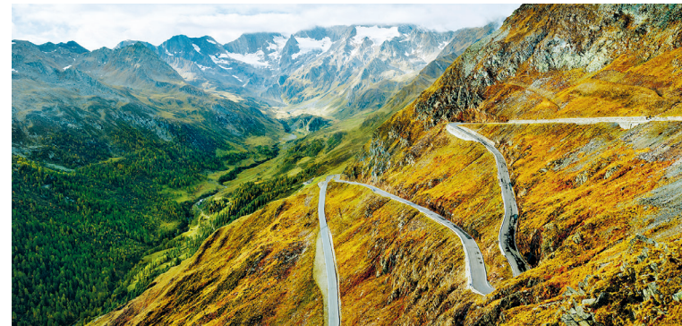
Alleen in de zomermaanden en bij mooi weer tot in de herfst is de bochtige pasweg over het Timmelsjoch berijdbaar. Het hoogste punt – 2509 m – verraadt waarom: hierboven valt veel sneeuw, die lang blijft liggen.

Het Ultental/Val d'Ultimo (D C 5-E 4) is een wereld op zich. Een 'laatste dal', zoals de huidige Italiaanse naam suggereert, is het mooie bergdal echter niet. Waarschijnlijk is dat de naam teruggaat op een man uit een ver verleden, die luisterde naar de naam Ulte-nu. Het dal begint bij Lana (D E 4) en klimt dan over een lengte van circa 40 km geleidelijk omhoog naar de gletsjers van het Ortlermassief. Tot het einde van de 19e eeuw was het dal nauwelijks bereikbaar. De toenmalige bevolking leefde hoofdzakelijk van de houtproductie en de veeteelt. Pas in 1907