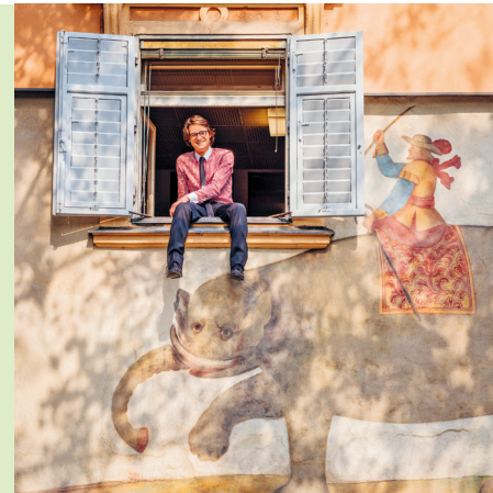
Onderdak, ook voor olifanten, in ieder geval voor de op een muurschildering vereeuwigde Soliman: Hotel Elephant.

Het is 21 december 1551. Dit is in Brixen de dag van de traditionele Thomasmarkt, maar toch verzamelt iedereen zich bij de stadspoort, bij de herberg Am Hohen Feld. In de grote stallen is namelijk een dier te zien dat nog nooit in de bisschopsstad te aanschouwen was: Soliman, een olifant uit India. Het enorme dier, een huwelijksgeschenk voor aartsbisschop Maximiliaan van Oostenrijk en zijn Spaanse echtgenote Maria, zal in het gevolg van het echtpaar vanuit Genua door de Alpen trekken. Veertien dagen lang kan