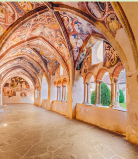
In de kruisgang van de dom van Brixen kun je op zoek gaan naar een afbeelding van het 'oli-paard'.

Voordelig zijn de beide gourmetrestaurants in Hotel Elephant 3 niet echt. Maar je hoeft de Elephantenplatte natuurlijk niet te bestellen. Een koffie of aperitief in de Bar-Lounge (dag. 7-23 uur) is ook voldoende, om aansluitend rond te kijken in het hotel vol historie.