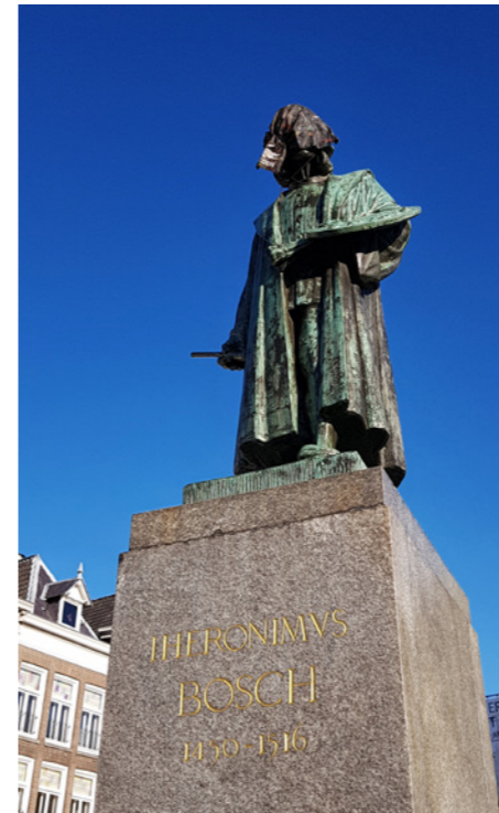
Standbeeld van Jheronimus Bosch

Varken (vreemde straatnamen hebben ze in Den Bosch). Bij de bocht naar rechts, verderop, staat het gemeentelijke stadskantoor met moderne vliesgevel aan je rechterhand. Achter het Wild Varken gaat vanaf hier verder als Wolvenhoek. Na zo'n 75 m bereik je een kruispunt met aan de overzijde het Anne Frankplein.