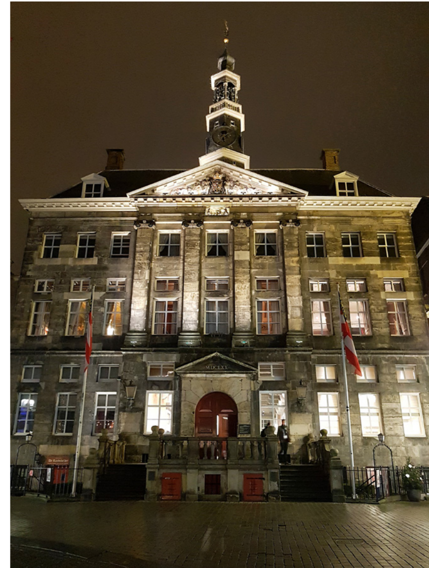
Het oude stadhuis op de Markt

hoek en het Anne Frankplein gaat de route naar links, de Waterstraat in. Sla aan het einde rechtsaf, de Verwersstraat in. Na minder dan 30 m is aan je rechterhand het plein voor de hoofdingang van het Noordbrabants Museum.