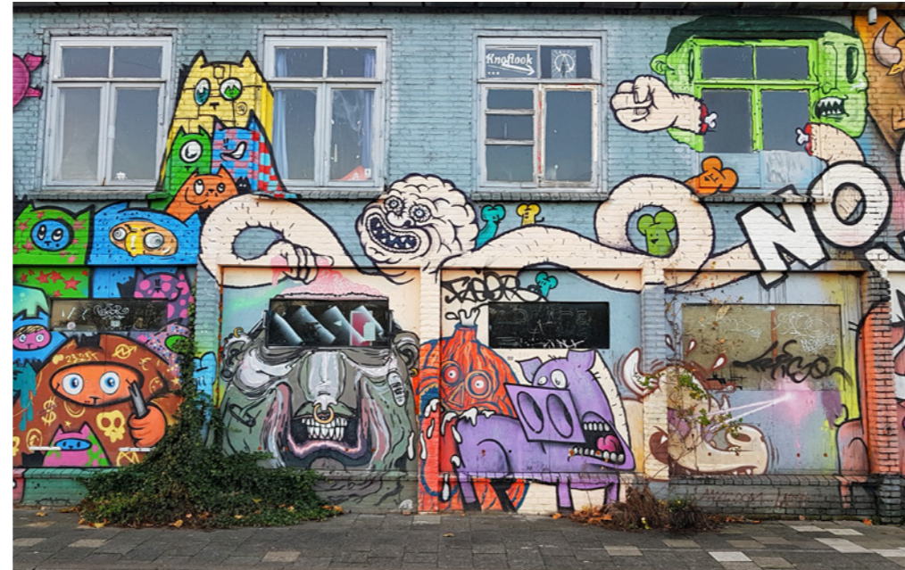
Kraakpanden langs de Havenkade

leven ingeblazen. In de Mengfabriek zit bijvoorbeeld een heel scala aan bedrijfjes en hippe horeca. In de gebouwen rechts ervan huizen onder meer een boksschool, een skate center en een breakdance en hiphop dansschool. Het Werkwarenhuis links daarvan is het creatieve centrum van het terrein en in de 2800 m 2 grote Kaaihallen nog verder naar links, vinden evenementen plaats ( www.mengfabriek.nl ).