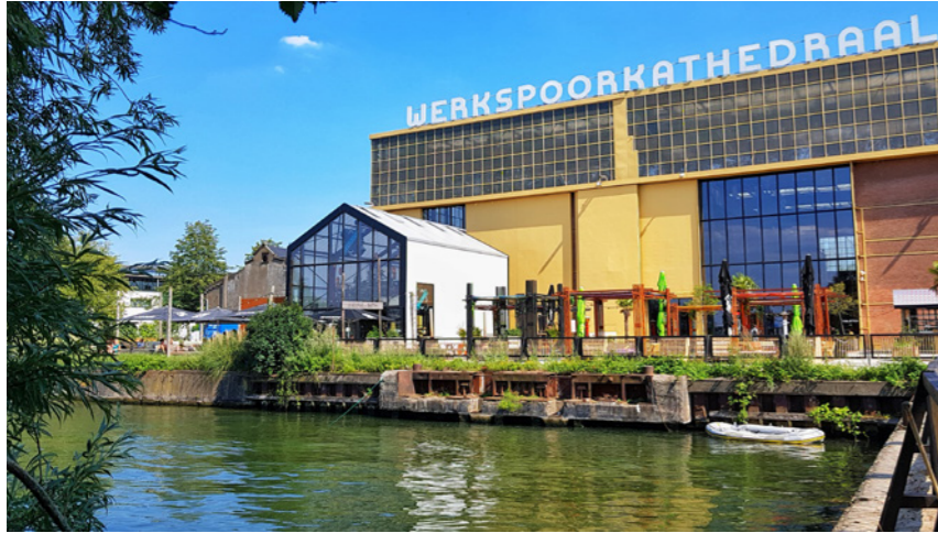
Werkspoorkathedraal en proeflokaal De Leckere