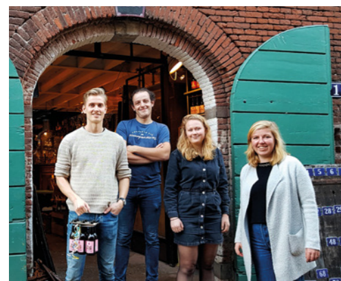
Bij de brouwerij