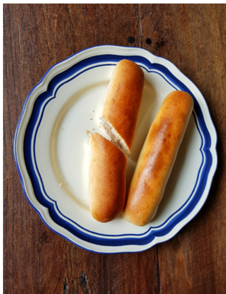
Twee Brabantse worstenbroodjes

Als er markt is op de Markt , op woensdag, vrijdag en zater-