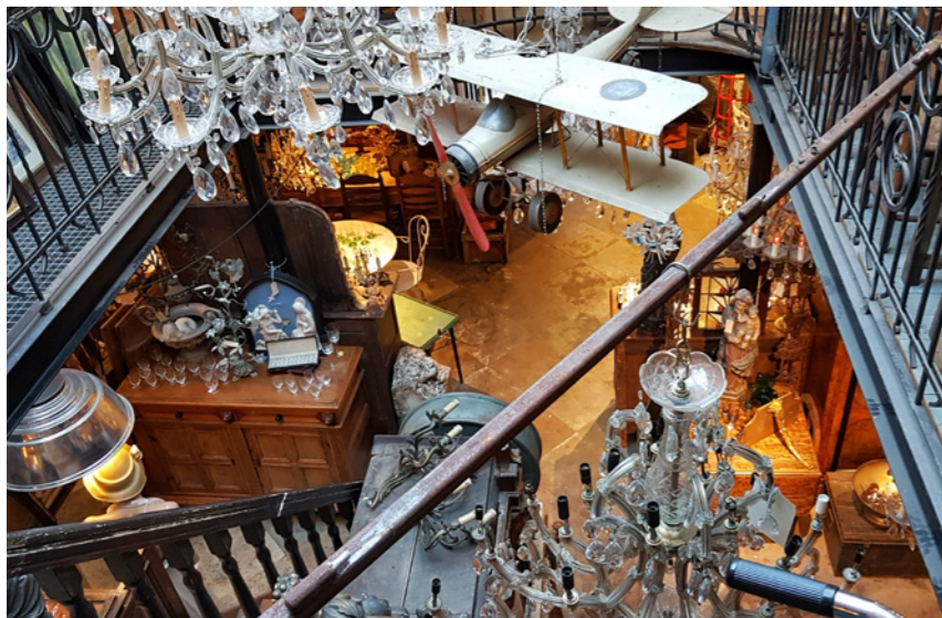
Antiek en curiosa in La Folie

Ga schuin tegenover de antiekwinkel met brouwerij links het Uilenburgstraatje in. Sla aan het einde rechtsaf en loop de Postelstraat in. Na iets minder dan 100 m loop je links de Stoofstraat in. Sla aan het einde rechtsaf naar de Snellestraat, een deel van het voetgangersgebied in de binnenstad. Steek 30 m verderop dwarsstraat de Schapenmarkt over en vervolg je wandeling door het voetgangersgebied over de straat Achter het Vergulde Harnas, die na zo'n 40 m overgaat in Achter het Wild