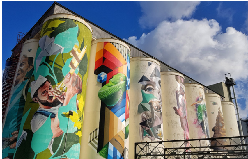
De oude mengvoedersilo's

te staan. De fabriek kreeg in 2004 een nieuwe bestemming als theatercomplex en telt nu twee theaterzalen, vijf filmzalen, een café-restaurant en repetitieruimten.