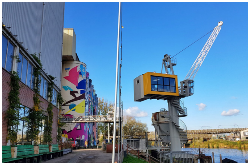
De Bossche Kraan, met unieke suite erin

Mengfabriek werd rond 1909 gebouwd en is een rijksmonument. Hier begon ooit een meelfabriek die na de oorlog van locatie ruilde met een mengvoederfabriek uit Rotterdam. In 1983 kwam de fabriek in bezit van De Heus Voeders, de eigenaar die in 2014 dus de lichten uitdeed. Onder regie van de gemeente Den Bosch is het complex vervolgens nieuw