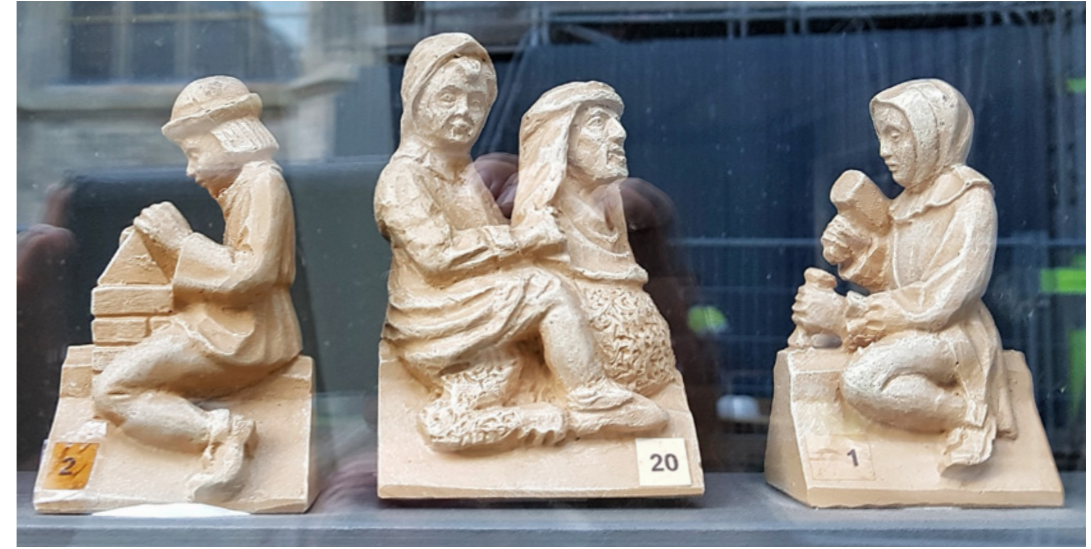
Replica's van beeldjes op de Sint-Jan

gebouw is ingericht als beeldtuin. Verder is de permanente presentatie De wereld van Bosch beslist de moeite waard, die inzicht biedt in de geheimzinnige beeldtaal van Jheronimus Bosch.