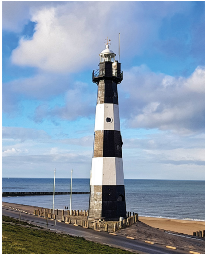
Vuurtoren Nieuwe Sluis