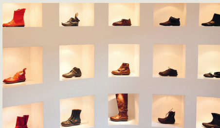
Trippen – de schoen vormt het bewustzijn

Kleine onafhankelijke winkels vind je in alle wijken. Het worden er zelfs steeds meer. Telkens weer begint iemand voor zichzelf, hoewel het niet eenvoudig is om geschikte winkelruimte te vinden. Leegstand komt dan ook niet voor. Overal floreert de handel. Bijkomend voordeel is dat het toerisme goed over de stad wordt verspreid. Mooi, toch?