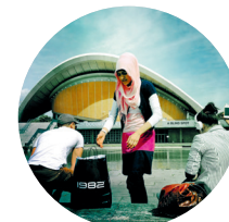
Multiculturele mode: een Kreuzberger variant van hoofddoekje, jurk en broek

Tiergarten: aan de ene kant de zetel van de bondspresident en aan de andere kant de bondskanselierij. En daartussen is het chillen en (minder graag gezien) barbecueën. Een minister op de fiets? Het kan zomaar gebeuren