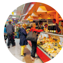
Kaas en wijn – biologisch winkelen in de markthal

Marheinekeplatz, Kreuzberg, U: Gneisenaustraße, meine-markthalle.de, ma.-vr. 8-20, za. 8-18 uur