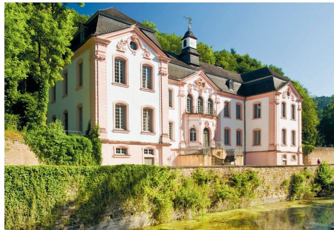
Het barokslot Weilerbach tussen Bollendorf en Echternach is een fijn wandeldoel.

Behalve de Eifel-Ardennen-Radweg (blz. 108) is er voor fietsers de Prümтал-