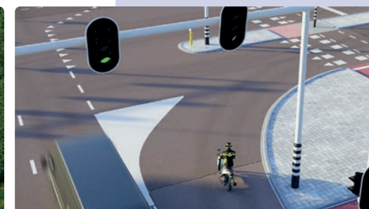
Ook op het puntstuk mag je niet rijden. Het puntstuk leidt het verkeer in de juiste richting.