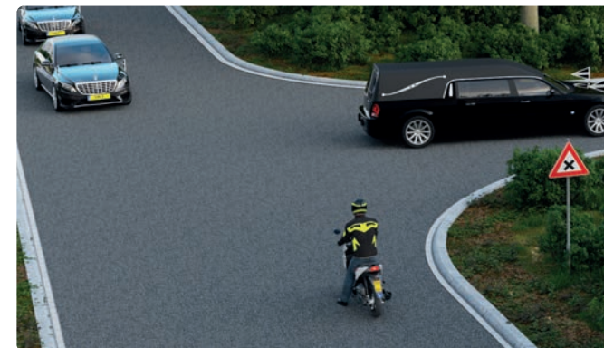
Een militaire colonne of uitvaartstoet mag je niet doorsnijden.

Deze stoet bestaat uit een rouwauto en volgauto's. Zij begeleiden een overledene of de as van een overledene naar de laatste rustplaats. Een uitvaartstoet -of rouwstoet- herken je aan het herkenningsteken.