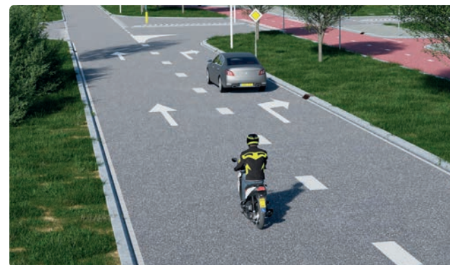
Je mag hier over de blokmarkering rijden om voor te sorteren naar rechts.

Blokmarkering is een brede onderbroken streek die je mag overschrijden. Blokmarkering geeft invoeg-, uitrijstroken of splitsingen in wegen aan. Ook voorsorteerstroken worden soms met blokmarkering aangegeven.