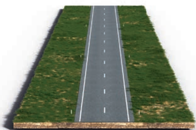
Een gewone onderbroken streek.

De waarschuwingstreep is een speciale markering op de weg. Deze streek heeft lange strepen en korte onderbrekingen. De waarschuwingstreep waarschuwt je, bijvoorbeeld voor een gevaarlijke bocht of onoverzichtelijke situatie. Meestal volgt na de waarschuwingstreep een doorgetrokken streek.