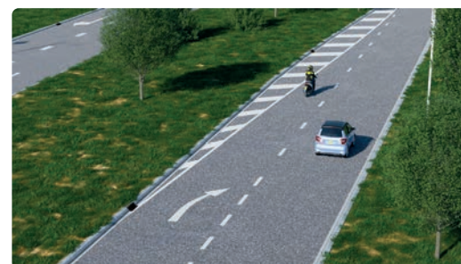
Op het verdrijvingsvlak mag je niet rijden. De pijlen wijzen naar de kant van de rijbaan waar je moet gaan rijden.

Sommige markeringsvlakken verbieden je een bepaald deel van de weg te gebruiken. Dit zijn het verdrijvingsvlak en het puntstuk.