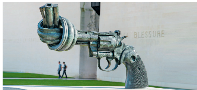
'Van zwaard tot ploegschaar' – hoofdthema van Le Mémorial in Caen is: Nooit meer oorlog! Veel indruk op de wapenproducenten maakt dat echter niet

Esplanade Eisenhower, memorial-caen.fr, bereikbaar via de Périphérique Nord, afrit 7, met de tram vanaf het station naar halte Tour-Leroy, dan verder met buslijn 2, apr.-sept. 9-19, okt.-dec., feb.-mrt. 9.30-18 uur, €19,80