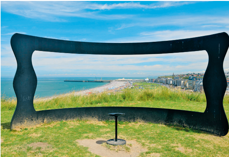
Een kijkvenster met uitzicht op het brede strand van Dieppe. Bij dit kunstwerk naast het kasteel staan zelfs zitbanken – bijna zoals thuis voor de buis

interieur uit de hooggotiek (koorgewelf) en de renaissance. Let op de mur des sauvages , een fries met reliëfs van de avonturen van de zeelieden uit Dieppe. Op zaterdag staan de kramen van de weekmarkt langs de kerkmuren. Via de al even fraaie Place du Puits Salé kom je bij de Église St-Rémy uit de 16e-17e eeuw (Rue St-Rémy, vanwege grote restauratie beperkt toegankelijk).