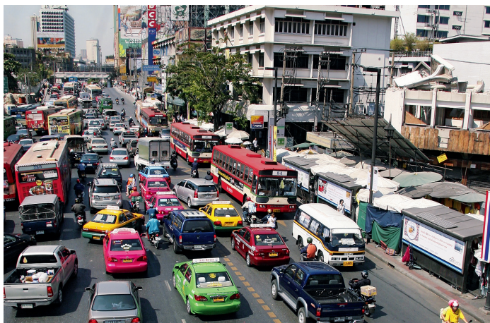
In de straten van Bangkok verliest u snel het overzicht

District, de navel van het bedrijfsleven in Bangkok. Langs de Thanon Silom vindt u niet alleen banken en winkelcentra, maar ook hotels en chique restaurants.