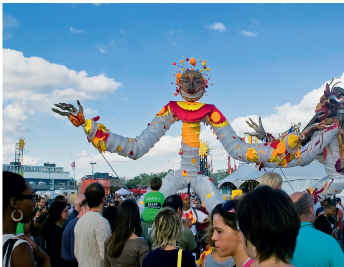
Kleurrijk, luidruchtig en fantasierijk is het Couleur Café-festival

twee niet zo opwindende, maar wel rustige en vriendelijke steden.