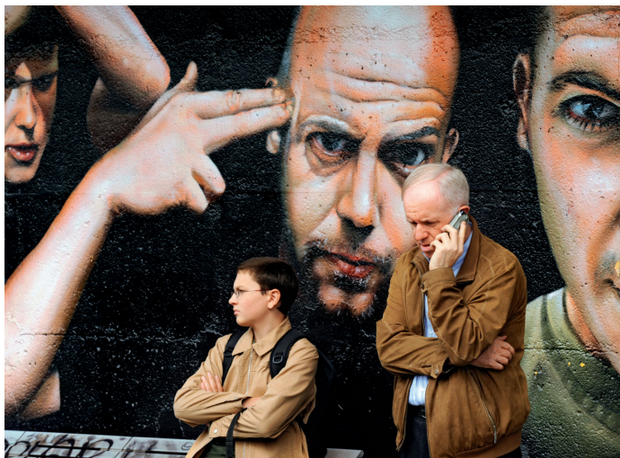
Openbare kunst is in Brussel alomtegenwoordig; de muurschildering bij tramhalte De Wand (Laken) is een van de grootste van Europa

Net zo onoverzichtelijk als de topografie is het bestuur van Brussel: het Brussels Hoofdstedelijk Gewest bestaat uit negentien gemeenten met vérstreckende bestuurlijke en economische bevoegdheden – en een eigen prachtig gemeentehuis om deze bevoegdheden vast te leggen. Een aantal culturele vraagstukken is daarentegen in handen van de Communauté française , het Franssprekende publiekrechtelijk lichaam, dat Wallonië en Brussel vertegenwoordigt. Voor soortgelijke zaken aan Vlaamse zijde bestaat er niet zo'n orgaan, deze worden meegenomen door de regio Vlaanderen. Al deze verschillende colleges en commissies met hun bevoegdheden die elkaar vaak overlappen, dragen het nodige bij aan de verwarring. Het rommelige naast elkaar bestaan van de verschillende organisaties kan gemakkelijk omslaan in een vrolijke chaos en soms zelfs in pure anarchie, waar regels en wetten hoogstens de