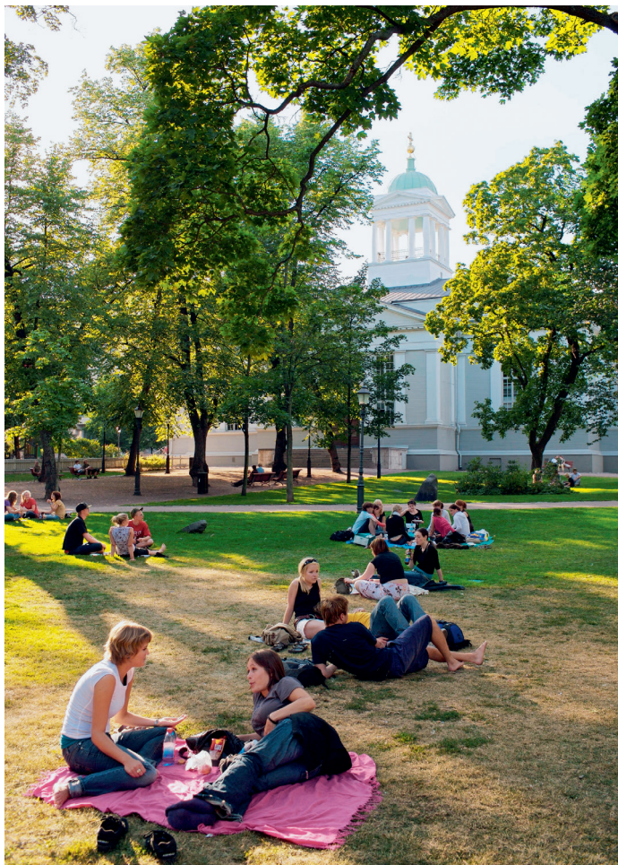
's Zomers is het park bij de Oude Kerk een geliefd trefpunt