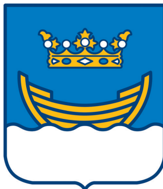
Het stadswapen van Helsinki

Een bekroonde boot siert het stadswapen van Helsinki. De overgang tussen stad en zee is letterlijk vloeiend. Het land vindt een voortzetting in honderden archipels, eilanden en scheren, nu eens dicht bebost, dan weer slechts een kale granietrots. En de Oostzee dringt met