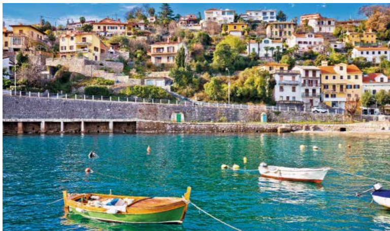
Boven: Opatija gaat in het zuiden over in het vissersdorpje Ičići