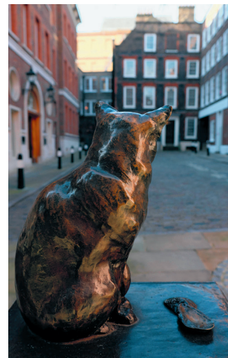
Samuel Johnsons kat Hodge vraagt zich af wie er allemaal in en uit loopt in haar huis aan Gough Square

Het aanvankelijk nogal bescheiden stadspaleis Nottingham House kwam in 1689 in bezit van Willem III. De koning liet het bouwwerk van Christopher Wren vergroten en verbouwen tot zijn Londense residentie. George I en zijn architect William Kent zijn verantwoor-