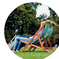
In St James's Park, sinds Hendrik VIII het park waar koningen wandelden of jaagden, kun je nu lekker in een ligstoel chillen

De roodgeverfde boulevard van Trafalgar Square naar Buckingham Palace heet The Mall . Aan de ene kant ligt St James's Park (► blz. 84), aan de andere kant staan grandioze town houses en paleizen, zoals St James's Palace 8 (► blz. 82) – nog altijd de officiële residentie van het Britse koningshuis –, Clarence House 9 en Lancaster House 10, zetel van het Commonwealth-secretariaat. Buckingham Palace 11 is omgeven door hoge muren en gietijzeren hekken. Gewone mensen hadden eigenlijk alleen toegang als ze door de vorst met een orde of adellijke titel werden beloofd of voor een garden party waren uitgenodigd. In 1992 kwam hierin verandering nadat Windsor Castle was getroffen door een verwoestende brand. De koninklijke huishouding had geld nodig en kwam op het idee om de negentien state rooms (staatsievertrekken) open te stellen voor betalende bezoekers – weliswaar alleen in augustus en september, wanneer de royal family zich van oudsher terugtrekt op haar kasteel in Schotland. In 1703 werd het paleis gebouwd voor de Duke of Buckingham. Koninklijke residentie werd het gebouw pas toen George III het in 1775 kocht voor zijn koningin Charlotte von Mecklenburg-Strelitz, met wie hij vijftien kinderen kreeg. Pas in de 19e eeuw werd het gebouw officieel residentie van een regerende monarch. Victoria was de eerste die het paleis betrok.