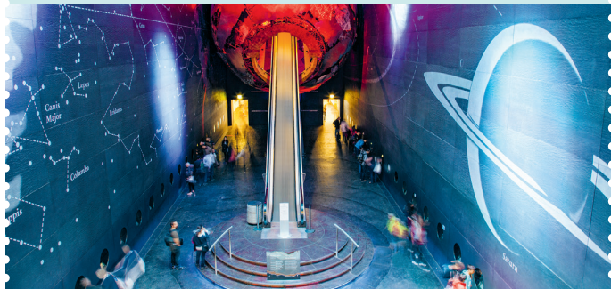
In de Earth Hall van het Natural History Museum draait alles om het ontstaan van onze planeet

De meeste grote musea en veel galeries zijn gratis toegankelijk, maar een donatie is altijd welkom, zelfs als er wel voor toegang moet worden betaald. Hiervoor staan er in de hal plexiglasen trommels, waarin bezoekers kleingeld kunnen gooien. Met de London Pass krijg je korting bij enkele musea die niet gratis zijn en in veel gratis musea een extraatje, zoals een audioguide. In de regel hoef je alleen bij heel populaire speciale tentoonstellingen op een wachttijd te rekenen. Als je je ticket vooraf online koopt, kun je meestal een tijdstip boeken (ook bij gratis musea).