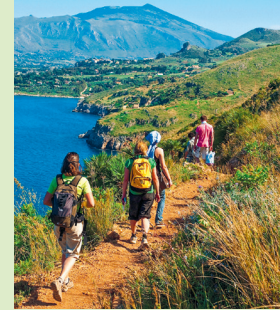
Wandelaars in het Riserva Naturale Orientata dello Zingaro

Leuke restaurants bevinden zich in het nabijgelegen San Vito Lo Capo en Scopello .