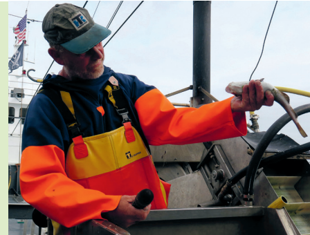
Wat hebben we hier? Aanschouwelijk onderwijs over allerlei vissoorten op de TX20

De scheepshoorn klinkt luid over het water als de TX20 de haven van Oudeschild verlaat. De kotter heet Walrus, is 31 m lang en ruim 8,5 m breed. Er zal in het ondiepere water, naast de vaargeul, gevist gaan worden, wat mogelijk is door de geringe diepgang van het schip (0,6 m). Het sleepnet wordt langzaam uitgezet en over een breedte van 8 m over de zeebodem getrokken – het loopt overigens letterlijk op rolletjes. Er wordt met de stroming mee gevist, en de boot mag daarbij niet te snel varen. Niet meer dan ongeveer 3,2 knopen. Anders zou het net te ver van de bodem af komen en de vis eronderdoor glippen. Nu is het een