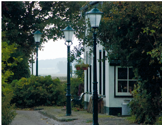
Idylle in De Waal: door het Veraningspad gloort in de verte de Hoge Berg