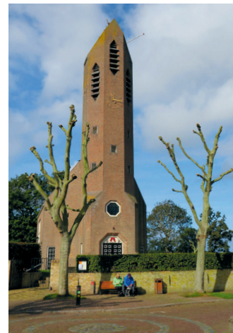
De kerk van De Waal in jarenvijftigstijl

Het toeristische hoogtepunt van het dorp is het liefdevol, in twee boerenhuizen ingerichte museum, in 1963 gesticht als het Wagenmuseum, nu Museum Waelstee (Hogereind 6, tel. 0222 312 951, cultuurmuseumtexel.nl, 1e di.