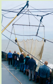
Nieuwsgierig naar de vangst

De tochten (ca. 2 uur) worden alleen gecancelled als er zware storm is. Flink wind, regen en mist zijn nooit spelbrekers! Je kunt ook met een eigen groep het schip reserveren. Meer info: Herman Blom, tel. 06 51 52 81 74.