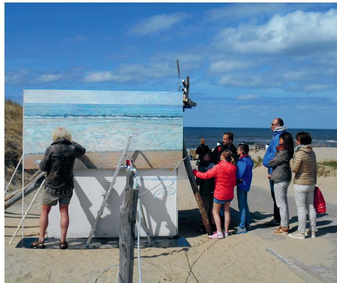
Eilandkunstenaar aan het werk

De kazen van Wezenspyk (Hoorn-derweg 29, tel. 0222 315 090, wezenspyk.nl ) kom je over het hele eiland tegen, klassieke boerenkoeienkaas maar ook schapen- en geitenkaas, al dan niet met kruiden. Je kunt vanuit de winkel (di.-za. 9.30-17 uur) een kijkje nemen bij het kaasmaken. Verdere mogelijkheden: een boerderijtoer met proeverij (apr.-okt); kaasfondue (za. 12-16 uur) in het Kaascafé, waar je tijdens de openingstijden van de winkel terecht kunt voor een kop koffie of natuurlijk een kaasplankje. En tot slot is er het Schapenmuseum in de schapenboet achter de boerderij geopend, bereikbaar via een landschapspaadje.