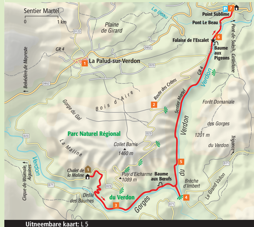
Uitneembare kaart: L 5

Bereikbaarheid: groepstaxi van La Palud-sur-Verdon naar Chalet de la Maline. Ook vanaf Point Sublime kun je een groepstaxi nemen. Nadere informatie bij Maison des Gorges du Verdon (► blz. 38).