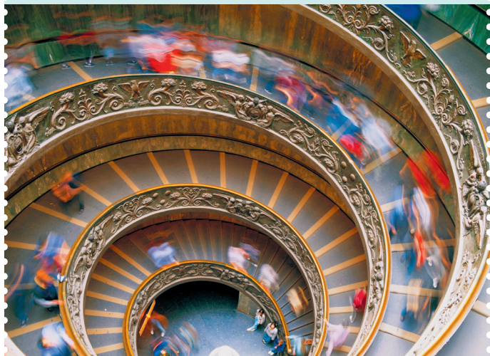
De spiraalvormige wenteltrap in de Vaticaanse Musea

Voor enkele bezienswaardigheden, waaronder het Colosseum, de Vaticaanse Musea en de Galleria Borghese, kun je voor een paar euro extra vooraf tickets reserveren, wat lange wachttijden voorkomt. Informatie: rome-museum.com of coopculture.it. Tickets voor monumenten en musea kun je telefonisch reserveren via tel. 06 39 96 77 00 of online op coopculture.it. Voor speciale tentoonstellingen betaal je boven op de entreeprijs doorgaans een toeslag (tot €5).