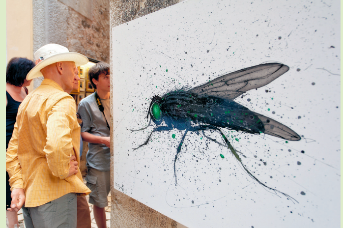
Over smaak en kunst valt wel degelijk te twisten. Zo ook in Atelier Devescovi