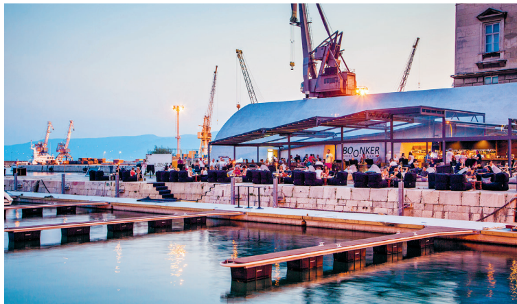
De jeugd van Rijeka viert nachten lang grote feesten waar vroeger containers werden gelost

kern van Rijeka. Via de poort en het Koblerov trg kom je uit bij het oude stadhuis. De stadspoort 7 (stara vrata) is nog afkomstig uit de Romeinse tijd (1e eeuw) en overspant een smalle steeg, die vanaf het Koblerov trg naar het noorden loopt. De kerk Maria-Hemelvaart 8 (crkva uznesenja blažene djevice Marije) heeft een vrijstaande klokkentoren. De in 1377 gebouwde toren leunt wat zorgelijk in de richting van de kerk. Bezienswaardig maar geen must is de boven in de oude stad gesitueerde, ronde kerk Sint-Vitus 9 (Crkva sv. Vida) in barokke stijl en het Marinemuseum 10 (pomorski i povijesni muzej). Er is een expositie te zien over de geschiedenis van de zeevaart en de haven van Rijeka (Muzejski trg 1, ma 9-16, di.-za. 9-20, zo. 9-13 uur, ppmhp. hr, ca. €4). Interessant is ook het in 1892 voltooid neoclassicistische gebouw dat het museum herbergt. Het heeft vroeger dienstgedaan als gouverneurspaleis. In sommige vertrekken verkeert het interieur nog in originele staat. Als je echter tijd tekortkomt, is de markt 11 een betere optie (Velika tržnica; ul. Ivana Zajca, ma.-za. 7-14, zo. tot 12 uur). Deze ligt tegenover het Modellopaleis. De markt is gehuisvest in een aantal jugendstilhallen. De koopwaar zoals fruit, groente en vlees