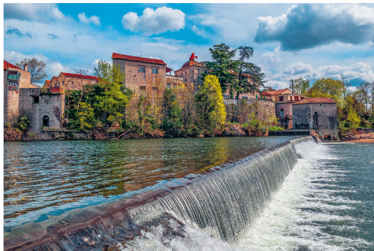
Kanoërs hebben eerst nog respect voor stuwen zoals hier bij Ruoms, tot ze de waterglijbanen ontdekken. Maar pas op: vaak zit juist hier een fotograaf op de oever die het moment vereeuwigt ...

Ten noorden van Ruoms ligt de imposante Cirque de Gens , een 180 m hoge rotswand in een bocht van de Ardèche. Er is daar een strandje, dat je met de auto bereikt door richting Chauzon te rijden.