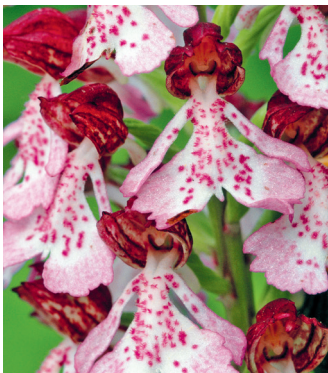
In de lente zijn de Causse bezaaid met orchideeën; een van de grootste is de purperorchis

Het park ligt grotendeels in het departement Lozère, met kleinere stukken in de departementen Gard, Hérault en Aveyron. Er mogen hier dan strenge regels voor de landbouw en rigide bouwvoorschriften van toepassing zijn, bezoekers zijn van harte welkom. Het omvangrijke netwerk van paden voor wandelaars, fietsers en ruiters maken de Causse en de Cevennen aantrekkelijk voor sportieve natuurliefhebbers (Place du Palais, cevennes-parcnational.fr, juni, sept.-okt. ma.-za. 9.30-12, 14.30-18, juli-aug. ook zo.).