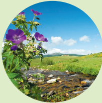
De Loire, de langste rivier van Frankrijk, begint als een rustig kabbelend beekje

Aan de voet van de weg ligt de Source de la Loire 2, maar ik moet erbij zeggen dat ook andere bronnen in de race zijn voor die titel. Als officiële bron geldt hier een beekje dat in een stenen