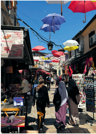
In de oude stad

Dit hotel beschikt op 5 minuten lopen ook over kamers en appartementen met uitzicht op de Vardar.