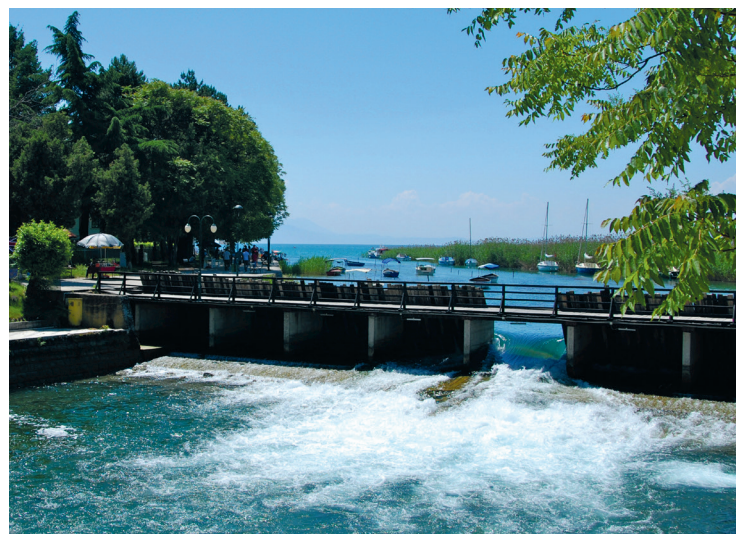
De rivier de Zwarte Drim dringt binnen in Struga

In hun geboorteplaats Struga zijn de gebroeders Dimitar Miladinov (1810-1862) en Konstantin Miladinov (1830-1862) in brons vereeuwigd en werd het culturele centrum naar hen vernoemd. Zij waren dichters en folkloristen die samen een belangrijke verzameling volksliedjes nalieten. Na zijn studie, onder andere in Griekenland, ging Dimitar les geven. Hij doceerde onder meer in Ohrid, Struga, Prilep en Bitola. Zijn jongere broer Konstantin, die nog les van hem heeft gekregen, hielp hem met het uitgeven van de door hem verzamelde volksliedjes. Dat waren er 665. Konstantin schreef bovendien zelf liederen. Zijn mooiste is T'ga za jug ('Verlangend naar het zuiden'), dat hij tijdens zijn verblijf in Rusland schreef (en waarnaar het wijnhuis Tikveš een van zijn rode wijnen noemde). Beide broers stierven in een gevangenis in Istanbul. Na hun dood werd het duo onderwerp van heftige discussies. Hun folkloristische activiteiten werden door de Macedoniërs geclaimd, maar de titel van de originele verzameling is Bulgaarse volksliedjes . De broers steunden bovendien de Bulgaarse nationale zaak. In 1983 verscheen de collectie in Skopje dan ook als de 'Verzameling van de Miladinov-broers'. Maar na 2000 keerde de oorspronkelijke titel terug, wat de nodige protesten opleverde.