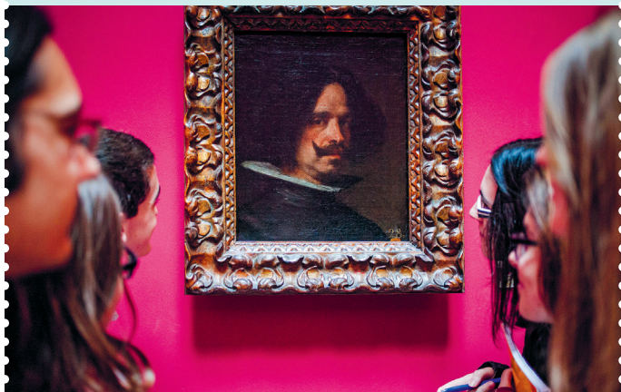
Zelfportret van Diego Velázquez in het Museo de Bellas Artes

In de musea is – zoals in Valencia gebruikelijk – de meeste informatie in het Spaans en Valenciaans. Doordat de stad (nog) niet door toeristen wordt overspoeld, zijn rondleidingen en uitleg niet altijd in het Engels beschikbaar.