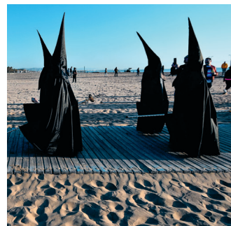
Goede Weekprocessie in Cabañal

Niet alleen in de stad Valencia, maar in de hele autonome regio Comunidad Valenciana wordt op de tweede maandag na Pasen een andere Vincent herdacht: San Vicente Ferrer, op 23 januari 1350 in Valencia geboren en tegenwoordig de beschermheilige van de regio Valencia. In zijn geboortehuis vind je een kapel, een kleine kerk en een met tegels versierde binnenplaats, die zeer de moeite waard is. C. Pouet de San Vicent 1, ma.-vr. 10-13, 17-19 uur, gratis