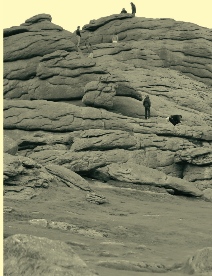
Een cairn, een brae, een men? Nee dit is Dartmoor, dus deze steenhoop is een 'tor'