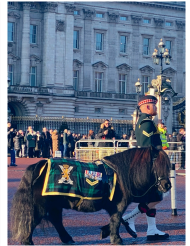
Horse Parade voor Buckingham Palace

St Martin-in-the-Fields, wisselende tijden, wo. 14.30 uur Church Tour, op vr. lunchconcerten, Café vanaf 10 uur