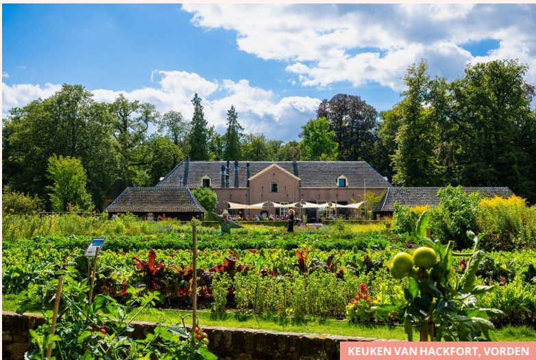
KEUKEN VAN HACKFORT, VORDEN

Bij De Lebbenbrugge stap je zo het boerenleven van vroeger binnen. Oude gebouwen, ambachten en verhalen laten zien hoe het leven hier ooit was. Het karakteristieke huis, met zijn opmerkelijke bouwstijl en fraaie interieur, was lange tijd het jachthuis van de heren van Borculo. Later werd het gebruikt als herberg, postwisselplaats, tolhuis en boerderij. Tegenwoordig is De Lebbenbrugge ingericht als boerenwoonhuis en boerderij van rond 1900. Het museum, dat voelt als een tijdcapsule, ligt vlak bij de natuurgebieden van landgoed Beekvliet en het natura 2000-gebied Stelkampsveld. Klein, overzichtelijk en verrassend leuk.