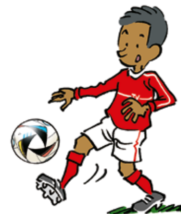
Kai is de aanvoerder.