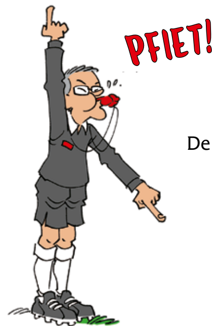
De scheids: hij ziet alles!