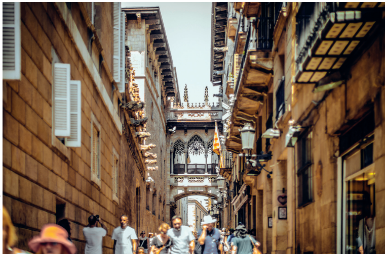
De smalle Carrer del Bisbe Iruita in de Barri Gòtic