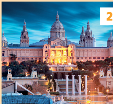
Montjuïc en zijn musea: MNAC ★★★ en Fundació Joan Miró ★★★ Vouwkaart B7 en C7 - blz. 88 en 93