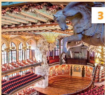
Palau de la Música Catalana ★★★ Vouwkaart D4 - blz. 40