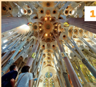
Sagrada Família ★★★ Vouwkaart D1 - blz. 65