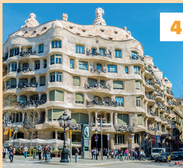
Casa Batlló ★★★ en Casa Milà ★★★ Vouwkaart C3 en C2 - blz. 63 en 64