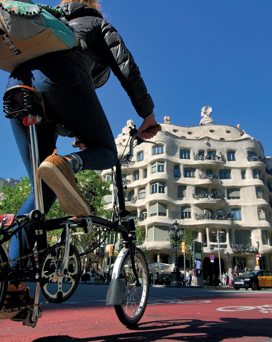
Casa Milà van Antoni Gaudí, een van de topattracties in Barcelona