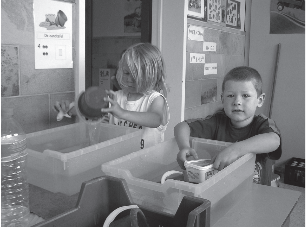
De zandtafel wordt een watertafel