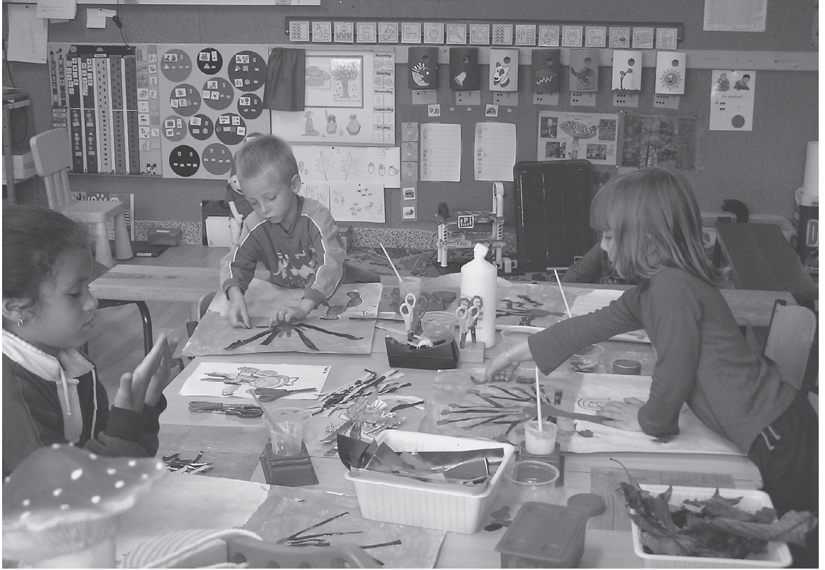
De knutselhoek in een herfstkleedje