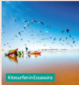
Kitesurfen in Essaouira

De sjerifische streetart viert hoogtij in Casablanca . Nu die uit het clandestiene is gehaald, heeft streetart eigen vedetten en festivals ( blz. 141 ).