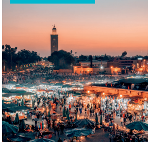
Place Jemaa El-Fna

Deze wijk rond het gelijknamige plein met de prachtige fontein (16de eeuw), de grootste van de medina, omvat riads, designerboetieks, antiek- en souvenirwinkels.