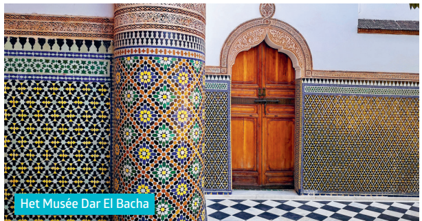
Het Musée Dar El Bacha