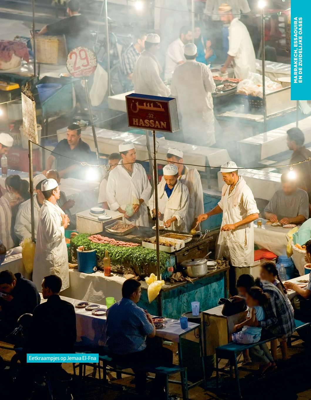
Eetkraampjes op Jemaa El-Fna