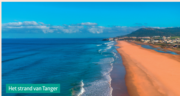
Het strand van Tanger

Van mei tot september is de verkoeling van de zee heel welkom! Aan de westelijke rif , evenals aan de kustlijn van Essaouira ontdek je tal van mooie stranden.