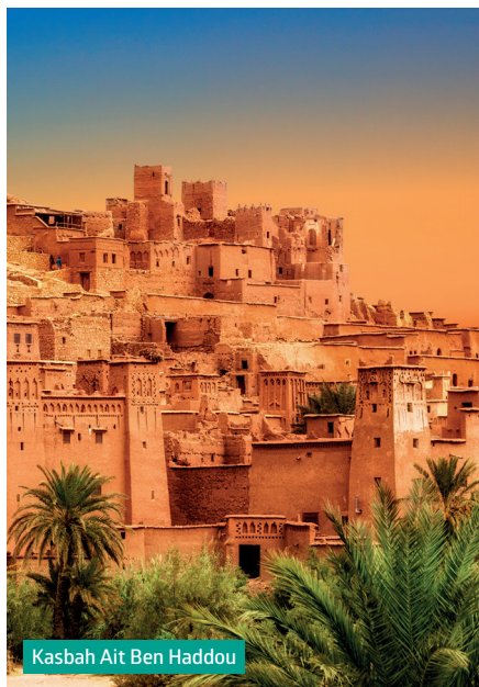
Kasbah Ait Ben Haddou