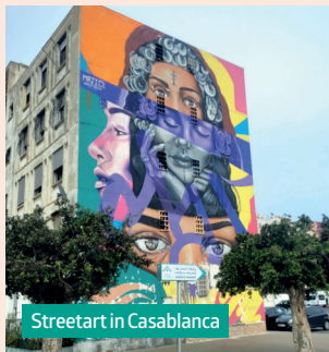
Streetart in Casablanca