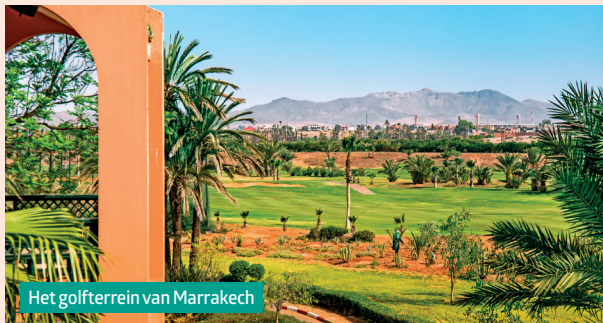
Het golfterrein van Marrakech

Ga watersporten op zee , geniet van wandelingen , speel een rondje golf ... Marokko weet elke sportieveling te verleiden ( blz. 74, 144 en 178 ).