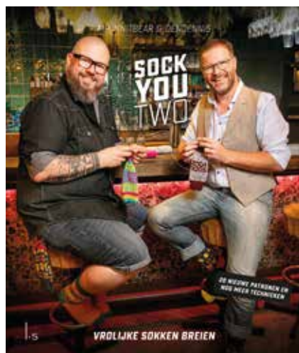
Sock You Two met Dendennis ISBN 978 90 245 9175 6