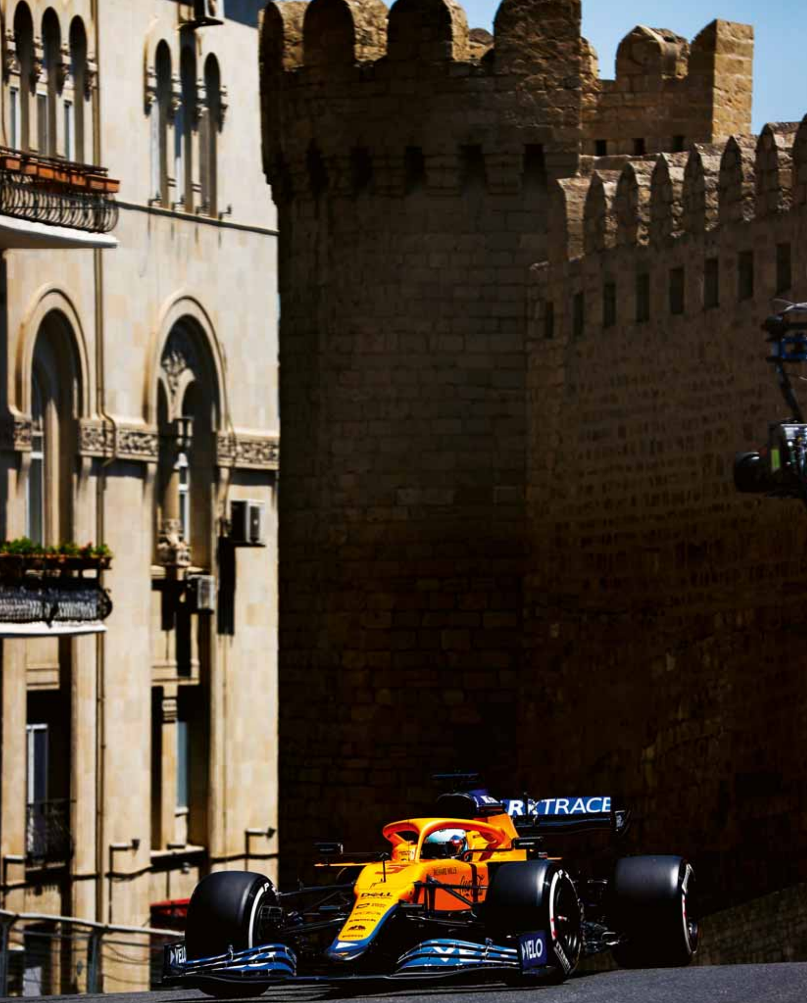
Daniel Ricciardo tijdens de kwalificatie voor de Grand Prix van Azerbeidzjan in 2021