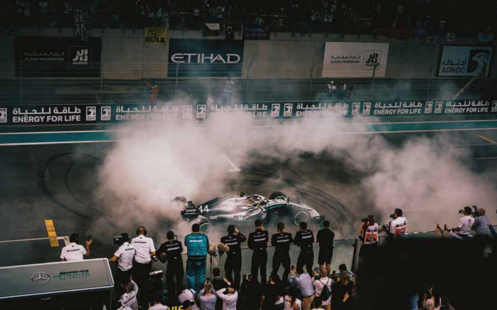
Lewis Hamilton draait donuts na de Grand Prix van Abu Dhabi, de slotrace van 2019