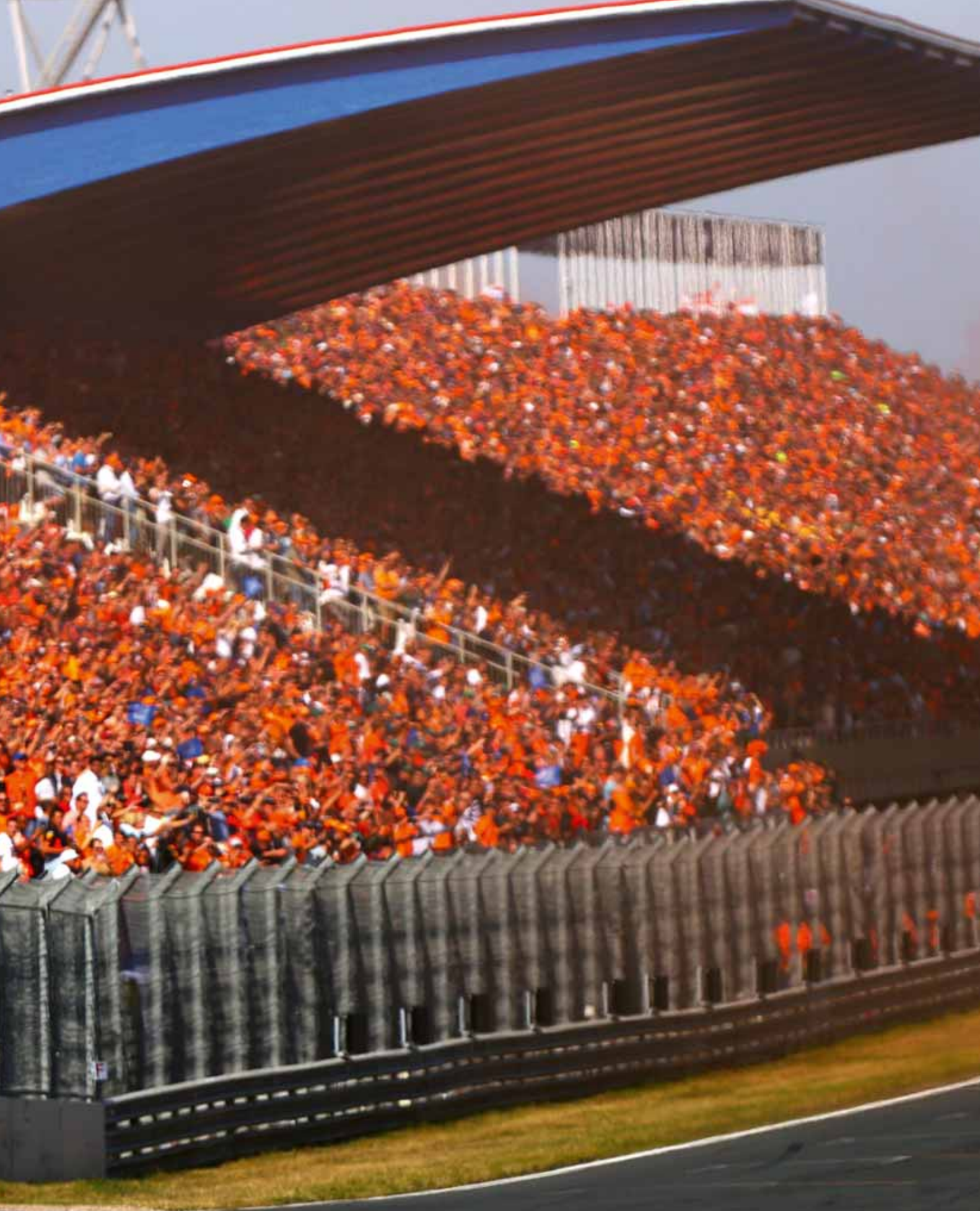
Max Verstappen tijdens de Grand Prix van Nederland in 2021