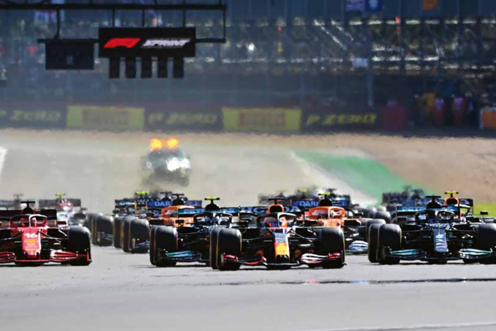
Max Verstappen neemt de leiding bij de start van de sprintkwalificatie voor de Grand Prix van Groot-Brittannië in 2021