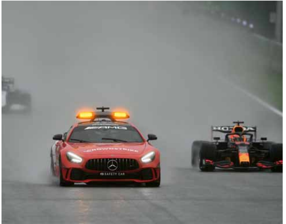
De safetycar leidt het veld tijdens de Grand Prix van België in 2021

De Grand Prix van België van 2021 is de kortste wedstrijd in de geschiedenis van de Formule 1. Door aanhoudende regen en het slechte zicht voor de coureurs werd de start van de race meerdere malen uitgesteld. Drie uur en een kwartier na de geplande start ging de safetycar met daarachter het startveld onder aanvoering van Max Verstappen de baan op. Er werden twee formatieronden gereden, waarna de race definitief werd stilgelegd. Conform de reglementen werd de uitslag bepaald na de eerste volledige formatieronde, waarmee Max Verstappen zijn zestienste Grand Prix-zege scoorde, zij het met halve punten.