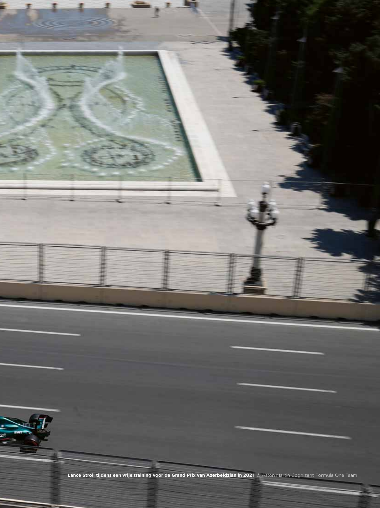
Lance Stroll tijdens een vrije training voor de Grand Prix van Azerbeidzjan in 2021