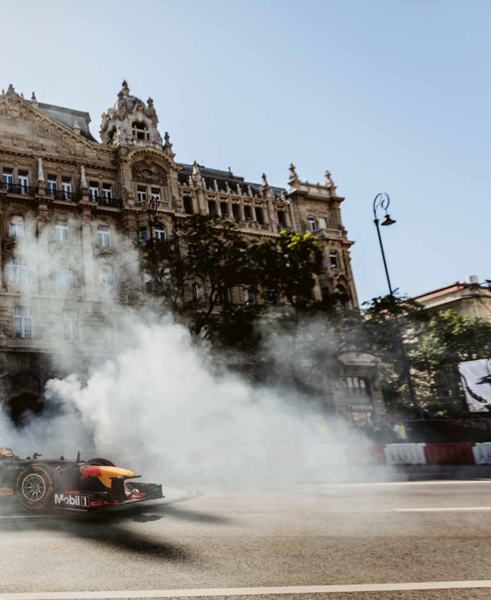
Demonstratie van Max Verstappen in Boedapest, Hongarije, in 2018