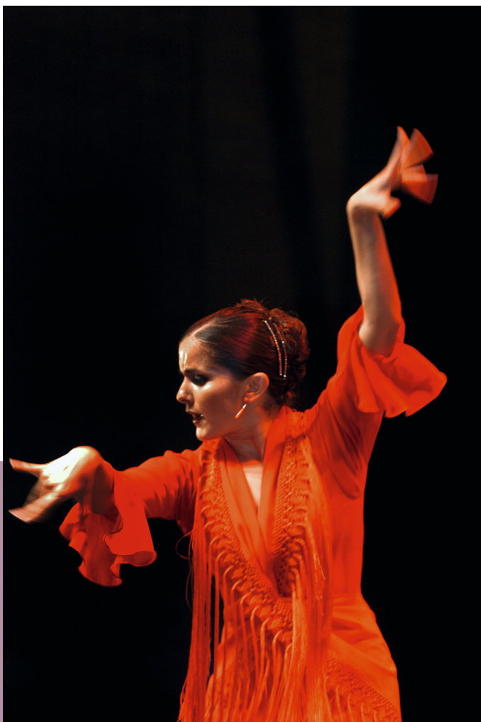
Gratie, bekoorlijkheid en hartstocht: danseres op de World Flamenco Fair in Sevilla