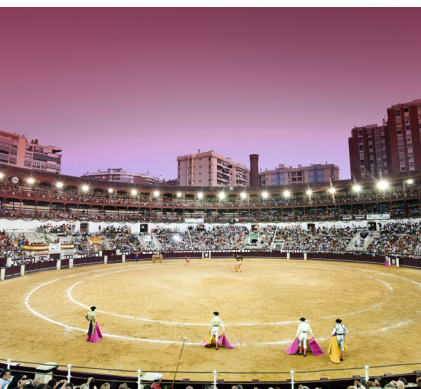
Arena voor stierengevechten in Málaga

Ook in Spanje groeit het aantal tegenstanders van het stierengevecht. In Andalusië, vooral in Ronda, Málaga, Jerez (► 53), Córdoba (► 114) en Sevilla (► 144), zijn er echter nog altijd talloze liefhebbers, aficionados , die de corrida als cultureel erfgoed en kunstvorm beschouwen. Als je het spektakel in de arena te bloedig vindt, houd je de aandacht dan maar bij de Andalusische toeschouwers – ook een zeer bezienswaardig schouwspel.