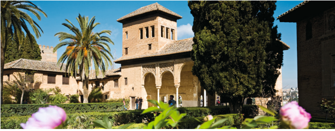
Binnenhof van het Alhambra