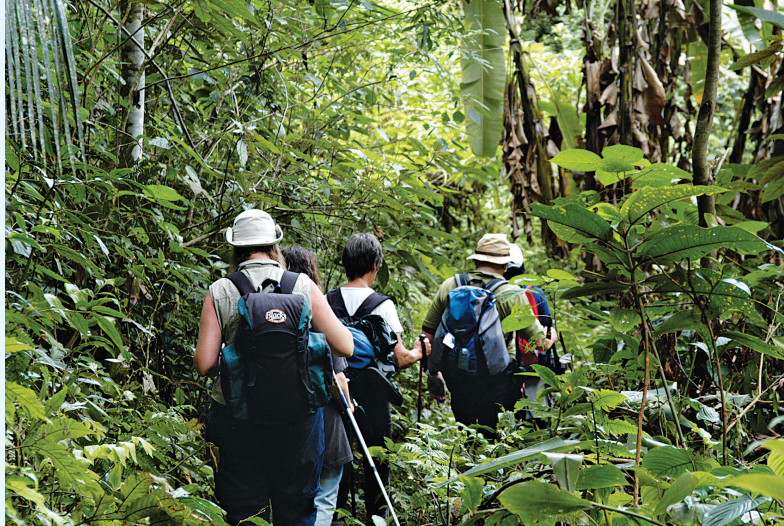
Wandelaars volgen de Trilha do Ouro (het goudpad) in Parque Nacional da Serra da Bocainak.

in het stadsdeel Pelourinho Centro Histórico getuigen. Wie graag de natuur in trekt, kan vanuit Salvador naar Chapada Diamantina reizen, zo'n 400 km landinwaarts; dit is een spectaculair nationaal park met rotsplateaus en watervallen. U kunt langs de zuidkust van Bahia ook de prachtige stranden langs het Atlantisch Woud gaan bekijken. Recife en zusterstad Olinda zijn ook mooie plaatsen in het noordoosten om te bezoeken – vanuit Recife kunt u de Cariri-regio bezoeken, waar zich de kurkdroge sertão bevindt.