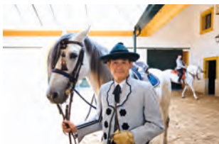
In de beroemde rij-school van Jerez de la Frontera