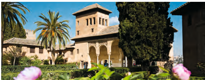
Binnenhof van het Alhambra