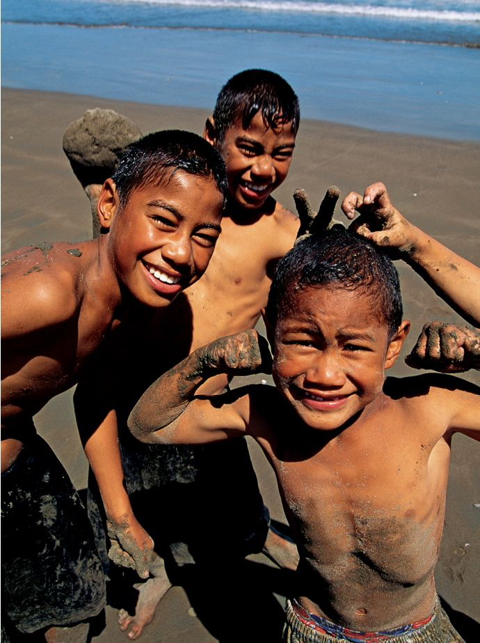
Maori-jongens op Waikanae Beach nabij Gisborne.

met hard werken, vastberadenheid en aanpassing. Kiwi's zijn trots op hun vindingrijkheid en zelfredzaamheid en beweren graag dat ze alles kunnen met 'Nr. 8 afrasterdraad', een verwijzing naar het op boerderijen veelgebruikte ijzerdraad.