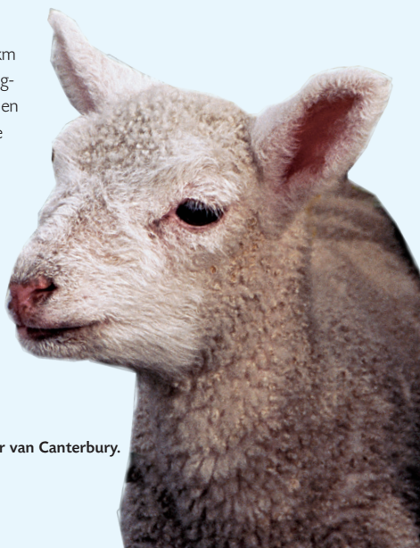
Bewoner van Canterbury.

Vanuit een telefooncel kunt u met muntgeld, creditcard of prepaid-kaart internationaal bellen. Internationale telefoonkaarten, verkrijgbaar bij krantenkiosk en supermarkt, zijn voor intercontinentale gesprekken het goedkoopst. Een Nieuw-Zeelandse prepaidkaart voor uw mobiele telefoon is een nuttige aankoop. Toets voor internationale gesprekken eerst 00 en vervolgens het landnummer, netnummer (zonder de 0) en het abonneenummer. (Zie Reiswijzer p. 280.)