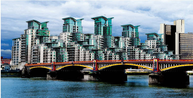
Vauxhall Bridge is een van de 34 bruggen over de Theems.