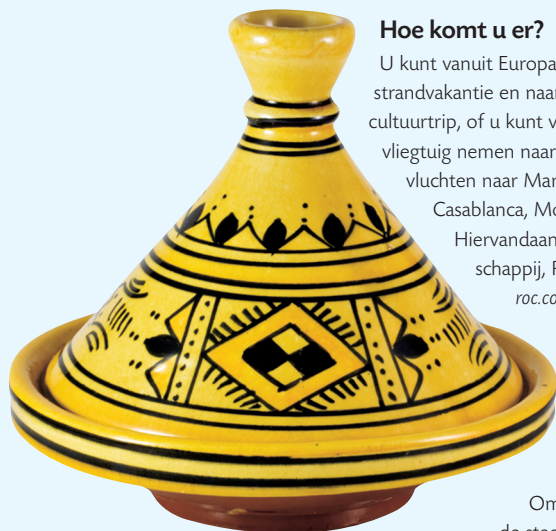
Een traditioneel beschilderde tajine .

Omdat Marokko een groot land is en de steden ver uit elkaar liggen, is vliegen een goede optie als u weinig tijd hebt.