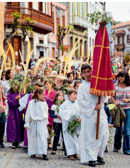
Palmzondagsprocessie in Teror

Om de religieuze inborst, maar ook de uitbundigheid van de inwoners van Gran Canaria te leren kennen, moet je echt eens een religieus feest bijwonen. Het grootste is 'La Virgen del Pino' in Teror, in het binnenland. Maar elke dorpskermis is minstens zo indrukwekkend, want vrijwel elke gemeente eert eens per jaar de eigen beschermheilige – eerst met een kerkelijke mis of processie, daarna met goede spijzen, dans en vuurwerk.