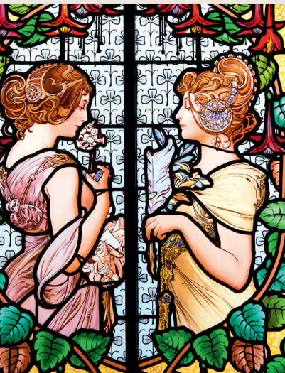
Gebrandschilderde ramen uit het modernisme, de Catalaanse art nouveau.

Bijna geen enkele andere Europese stad heeft zichzelf zo prachtig hervonden als Barcelona. Een ingrijpende facelift voorafgaand aan de Olympische Spelen van 1992 heeft