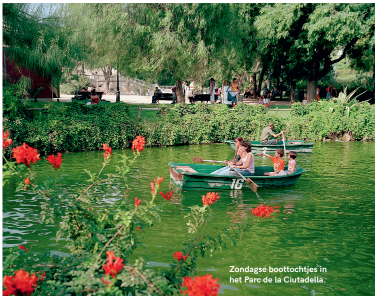
Zondagse boottochtjes in het Parc de la Ciutadella.