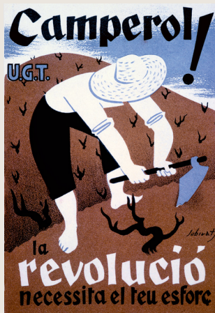
Kunstenaars geven op vele manieren uiting aan hun Catalaanse identiteit.

Na Franco's bewind heeft de Catalaanse identiteit zich sterk ontwikkeld. De provincie is de welvarendste van Spanje en is verantwoordelijk voor 20 procent van het bnp. Voor de Catalanen, die 11 procent van de Spaanse bevolking vormen, is Barcelona niet Spanjes tweede stad, maar de hoofdstad van