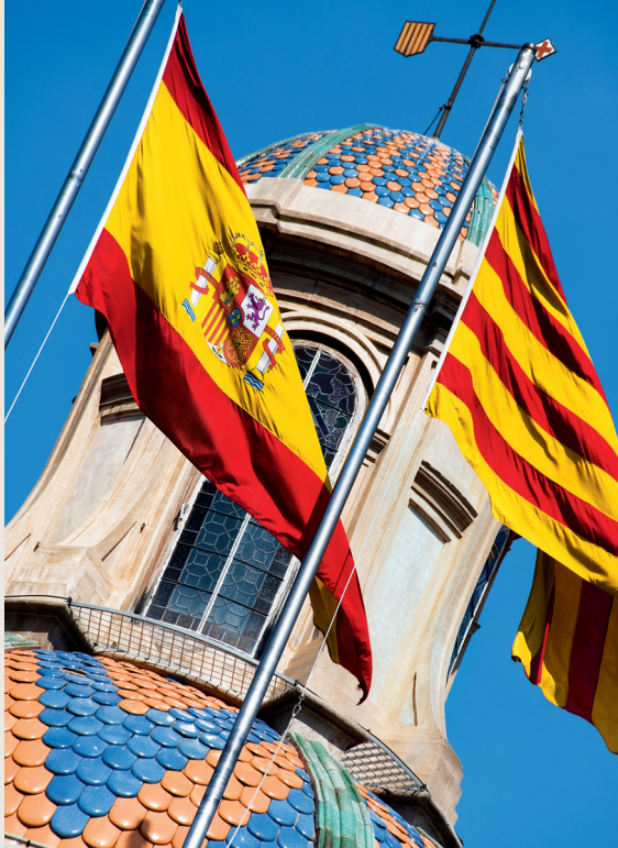
Boven het Palau de la Generalitat hangen de Spaanse en Catalaanse vlag.

grens in opstand kwamen en de onafhankelijkheid uitriepen. De opstand werd al snel neergeslagen. In 1652 capituleerde Barcelona voor het Spaanse leger en zeven jaar later werd Catalonië in het Verdrag van de Pyreneeën opgedeeld.