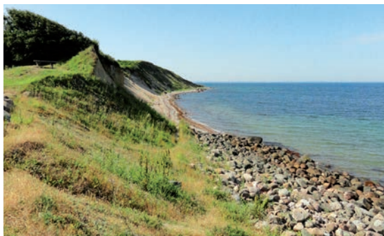
Schiereiland langs de zuidkust van Funen.

kinderen de historie van Lego ontdekt en eindeloos veel zelf kunt bouwen. Steek je de zeestraat Lillebælt over, dan kom je op het eiland Funen. De beroemdste bewoner van dit eiland was ongetwijfeld Hans Christian Andersen (blz. 53). In ‘zijn’ Odense treed je in de voetsporen van de schrijver van beroemde sprookjes. Maar Funen is ook het eiland van de kastelen, Egeskov (blz. 62) bijvoorbeeld, en van de kleurrijke tuinen, een mooie archipel in het zuiden en leuke havensteden zoals Faaborg en Svendborg.