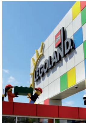
Legoland in Billund.