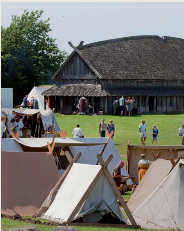
Jaarlijks is er een Viking Festival rond het voormalige ringkasteel Trelleborg (Seeland).

Nog steeds worden er nieuwe vondsten gedaan, bewijst een nieuwe archeologische opgraving bij Køge (blz. 123). Sinds de zomer van 2019 kun je hier over de schouders van archeologen meekijken naar de werkzaamheden bij de resten van een verborgen Vikingkasteel, dat een paar jaar geleden werd ontdekt. Met een speciale app en virtual-realitybril komt de geschiedenis tot leven.