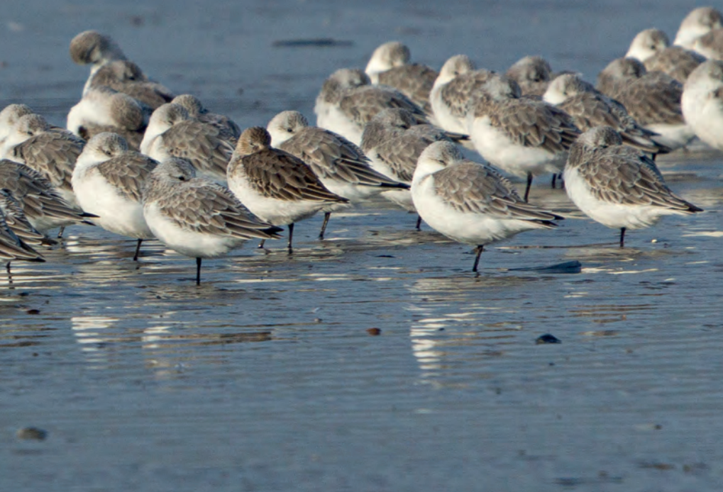
Drieteenstrandlopers, met in hun midden een bonte strandloper

In ieder mens schuilt wel een vogelkijker. Waar je ook bent, overal zie je vogels. In de tuin, op het balkon, langs de snelweg, op het gazon bij het kantoor, langs de rivier, aan de kust, in de duinen en in het bos. Er is geen plek te bedenken, waar je nooit een vogel zult zien. Er zijn wel plekken met heel weinig vogels en plekken met heel veel vogels. Ook zie je het hele jaar door vogels, maar dat zijn vaak niet dezelfde vogels en ook dan zijn ze niet overal even talrijk. Kortom: er is altijd wel wat te zien en daarvoor kun je ook op verschillende manieren naar vogels kijken.