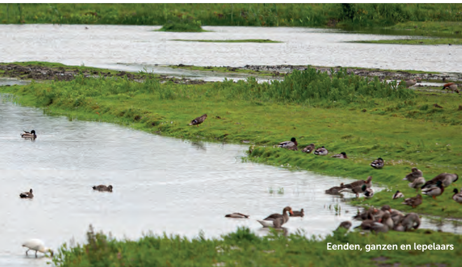
Eenden, ganzen en lepelaars

De meeste tips zijn niet bedoeld om je meer of 'betere' vogels te leren zien, maar om met meer zelfvertrouwen het veld in te gaan. Met voldoende basis-kennis, gebiedsinformatie, apparatuur en kleding kom je een heel eind.