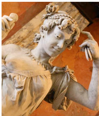
Muze in Teatro Nacional de Costa Rica in San José.

Links: een traditioneel ossenkar-wiel in de Fábrica de Carretas Eloy Alfaro, Sarchí.