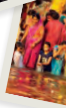
Onder: veel hindoes willen een plekje op de trappen bij de Ganges