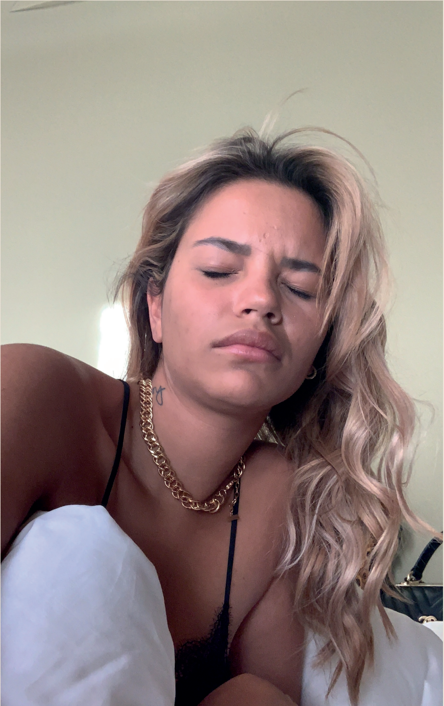
Even rustig wakker worden