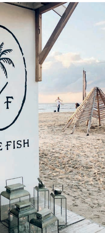
HIPPIE FISH, ZANDVOORT

WIL JE HEERLIJK UITWAAIEN OF UREN ZONNEN? GA NAAR EEN VAN DE FIJNSTE STRANDEN VAN NEDERLAND.