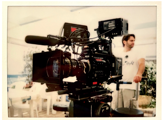
Panavision-camera's voor de 'Hak van de laars'-aflevering. Fasano, Italië, 2017.