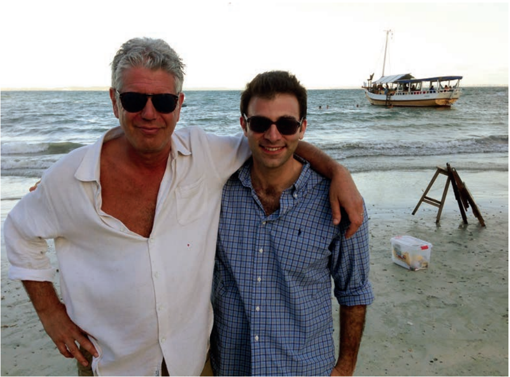
Tony en ik na de scène. Bahia, Brazilië, 2014. Todd Liebler