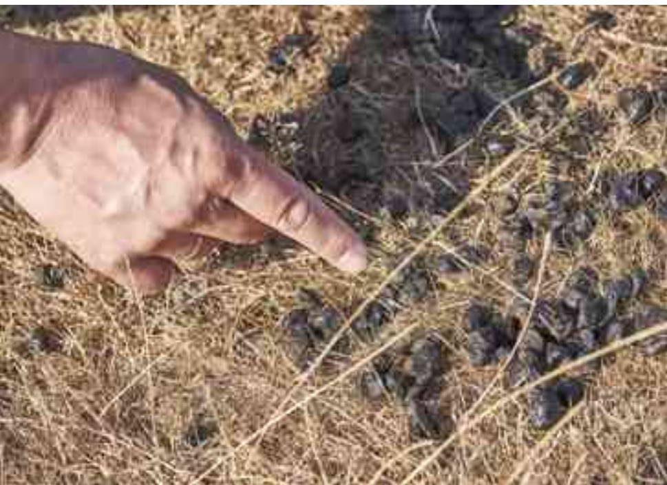
Aan deze hertenkeutels kun je zien dat de voeding droog was.

D at ingraven lukt alleen als de keutels stevig zijn. Maar soms is de poep van grote dieren flink blubberig. Dat kan twee oorzaken hebben: een dier is ziek en heeft diarree, of de voeding is zo sappig dat de poep ook heel nat wordt en er echt uit spettert. Dat gebeurt vooral in het voorjaar, als het veel regent. Dan bevat het verse jonge gras veel water en heel weinig vezels. Dat zorgt ervoor dat het in de buik flink rommelt.