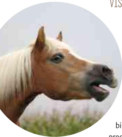
Heel hoog en lang hinniken betekent bijvoorbeeld: dit vind ik niet leuk!

NATUURLIJK KUNNEN DIEREN NIET PRATEN ZOALS JIJ EN IK. ALLEEN PAPEGAAIEN LUKT HET SOMS OM 'MENSELIJKE' WOORDEN UIT TE BRENGEN. MAAR NET ALS WIJ SPREKEN DIEREN MET ELKAAR IN HUN EIGEN TAAL, VISSEN BIJVOORBEELD.