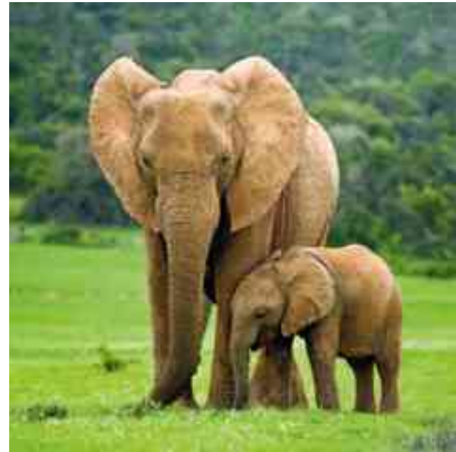
Olifanten herkennen elkaar ook aan hun stem.

O lifanten spreken ook door middel van geluiden. De klanken van sommige 'woorden' zijn zo diep, dat wij die niet kunnen horen. Dit diepe gebrom brengen ze via hun voeten in de grond, om andere olifanten te waarschuwen. Die 'horen' die geluiden ook met hun voeten en zo krijgen ze de boodschap dat er bijvoorbeeld leeuwen in de buurt zijn.