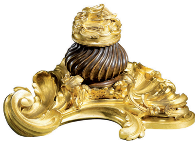
Een achttiende-eeuwse inktpot van 240.000 pond

Het ging snel bij Sotheby's: ik werd Company Director op mijn dertigste en in datzelfde jaar ook Head of the Furniture Department Europe. Vier jaar later was ik al Head of the Decorative Arts Division (lees: alles wat geen schildering is) én werd ik een van Sotheby's allereerste niet-Britse veilingmeesters . Dan kom je wel eens wat tegen. Zo werd ik uitgenodigd door een adellijke familie met de vraag om enkele van hun antieke meubels te komen schatten. Ter plekke werd mijn aandacht vooral getrokken door een licht exuberante inktpot. Daar hoefde ik niet te veel aandacht aan te besteden, vertelden ze mij, het was maar een rommelmarktvondst. Iets triggerde mij om de inktpot toch nauwgezet te bekijken. En wat bleek? Het ging om een verloren gewaand topstuk van Juste-Aurèle Meissonnier , hofleverancier van Lodewijk XV. Na enig opzoekwerk hebben we ook de tekeningen van 1735 teruggevonden en verkochten het uiteindelijk voor 240.000 pond aan een privécollectieur. Het Getty Museum moest toen het onderspit delven. Een andere keer kreeg ik een mailtje van een pizzeria in Stanford, Lincolnshire. Ze gingen het interieur helemaal omgooien en hadden nog een oud kastje staan, waarvan een van hun vaste klanten, een geschiedenisleerkracht, dacht dat het misschien wat waard