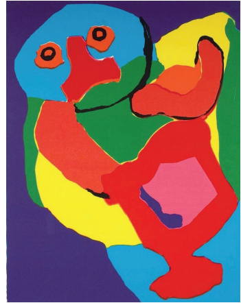
Mijn allereerste kunstwerk: een litho van Karel Appel uit 1971

Nu zou je denken dat ik voorbestemd was om kunstgeschiedenis te gaan studeren, maar toch liep het enigszins anders. Toen ik achttien was, overleed mijn vader na een slepende ziekte. Hij was zijn leven lang notaris geweest in het centrum van Brussel en wilde dat zijn twee zonen in zijn voetsporen zouden treden. Het was een ongeschreven contract, een belofte die ik niet kon verbreken, en dus vatte ik na zijn overlijden de studie rechten aan, zij het niet helemaal naar mijn zin. Maar ik wilde mijn belofte nakomen en ging ervan uit dat mijn tijd nog wel zou komen.