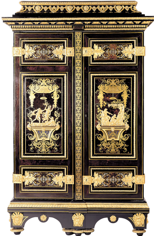
Kabinetkast met de befaamde Boulle-marqueterie

Ik vind de achttiende eeuw een razend interessante tijd. In mijn Londense appartement hangt ook een schilderij van de Vlaming Adam Frans van der Meulen. Hij was de officiële huisschilder van Lodewijk XIV. Zijn opdracht bestond erin om elke dag een schilderij te maken over de bouwwerken in Versailles. Zijn schilderij hangt tussen twee werken van street artist Banksy in. Een mens moet soms creatief durven om te springen met de tijd, niet?