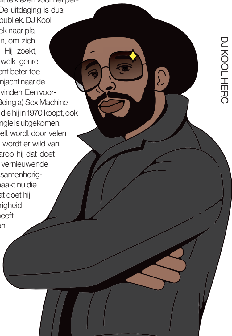
DJ KOO LHERC

De muziek die Herc speelt wordt door velen op prijs gesteld. Het publiek wordt er wild van. Maar vooral de manier waarop hij dat doet blijkt een gamechanger . Zijn vernieuwende ritme leidt tot een ongeziene samenhang op de dansvloer. Wat maakt nu die DJ Kool Herc zo uniek en wat doet hij om die sfeer van samenhang tot stand te brengen? Hoe heeft één man zo'n golf kunnen doen ontstaan? Wat heeft ervoor gezorgd dat wij, jonge hiphoppers van nu, nog altijd kunnen voortbouwen op wat hij heeft gedaan?