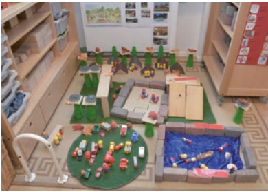
Camping in de bouwhoek

kocht. Bij het kopen van de ijsjes worden gesprekken gevoerd over welke ijsjes heel lekker zijn, welk ijsje je lievelingsijsje is en hoe waterijsjes gemaakt worden. De laatste vraag vormt de aanleiding voor een onderzoek naar het maken van vruchtensijsjes. Het benodigde fruit wordt geproefd, fijngemaakt en uitgeperst en vervolgens in vormpjes ingevroren. Daarna worden de ijsjes geproefd en er wordt een ijsjesposter gemaakt voor de winkel. Bij het onderzoek hoort ook het maken van een grafiek bij de vraag naar de lievelingsijsjes.