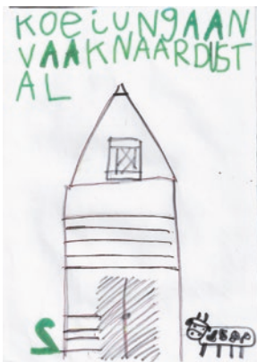
Koeien gaan vaak naar de stal