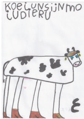
Koeien zijn mooie dieren