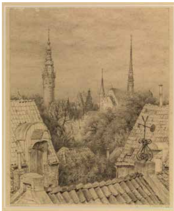
Uitzicht over Groningen vanuit het ouderlijk huis van Evert Musch aan de Brugstraat, 1948 contépotlood, 21,5x18,5 (privé bezit)

Reeds in 1939 maakte hij in opdracht van de uitgeverijen Boom in Meppel en Bosch en Keuning illustraties voor een tweetal boeken. Met het vrije werk exposeerde hij in 1940 in het Groninger Pictura, en in de plaatselijke pers verschenen positieve reacties naar aanleiding van de daar door hem getoonde werken.