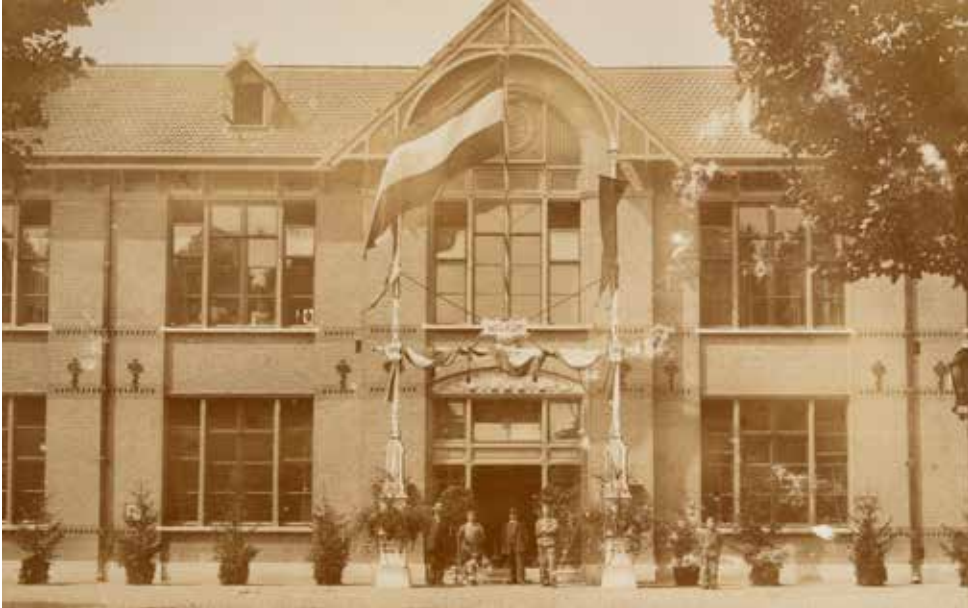
Welkom op het rijksoopvoedingsgesticht Veldzicht.

In dit boek wordt de geschiedenis van Veldzicht tussen 1894 en 1933 besproken. De geschiedenis van Veldzicht wordt verbonden aan de ontwikkeling van de criminele jeugdzorg gedurende de 19 e eeuw en aan het toenmalige maatschappelijke debat. De architectonische ontwikkeling van Veldzicht illustreert de veranderende omgang met de ‘verpleegden’ in de praktijk. Daarnaast wordt de wereld waarin de verpleegden van Veldzicht leven gekoppeld aan hun ervaringen. Door deze verschillende invalshoeken met elkaar te verbinden komt het verhaal van Veldzicht – het gesticht, het complex en de gronden – tot leven. De veranderende opvattingen in de maatschappij over de (her)opvoeding van misdadige jongens hebben een zichtbare invloed op de manier waarop het gebouw zich ontwikkelt. Het oorspronkelijke gebouw en de gronden ondergaan na de eerste oplevering nog veelvuldige veranderingen. Het is een gebouw dat leeft, dat meegroeit met haar gebruikers en de samenleving om haar heen. Interessant genoeg leeft dit gebouw nog steeds. Als enige van de voormalige rijksoopvoedingsgestichten wordt het complex van Veldzicht tot de dag van vandaag voor soortgelijke doeleinden gebruikt. Hoewel de doelgroep is veranderd, heeft Veldzicht nog steeds een penitentiaire functie en is het verleden nog duidelijk zichtbaar in het complex en het omringende landschap.