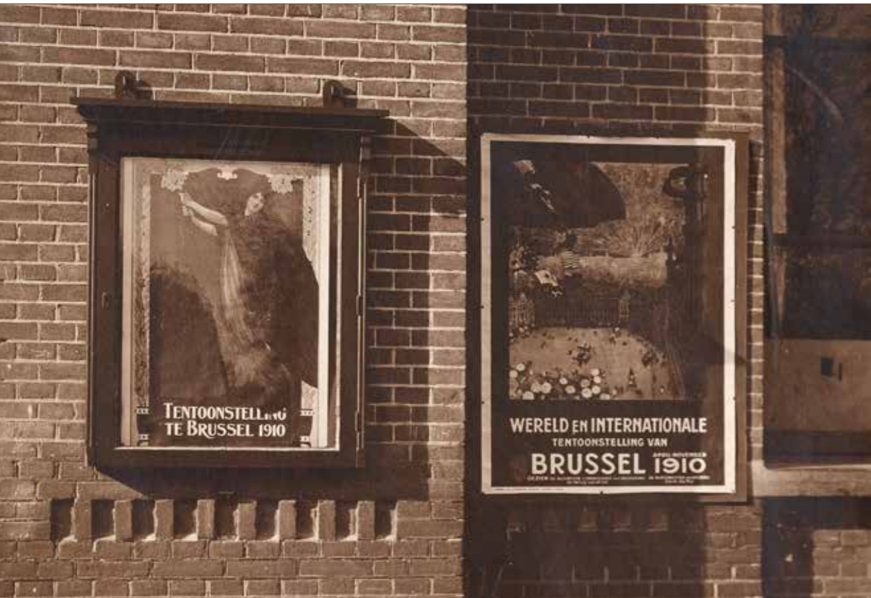
'Het laatste nieuws.' Posters ter gelegenheid van de Wereldtentoonstelling in Brussel, te zien op Veldzicht.

Nationaal en internationaal is er dan al veel interesse in deze vorm van residentieel opvoeden. In deze periode ontstaat er een grote West-Europese uitwisseling van ideeën over het straffen en heropvoeden van kinderen. Er worden congressen georganiseerd en overheidsvertegenwoordigers bezoeken in andere landen inrichtingen, strafkoloniën en strafinstellingen. Het feit dat deze foto's zijn gemaakt voor de wereldtentoonstelling weerspiegelt het belang van dergelijke instellingen aan het begin van de 20 e eeuw en de nationale trots ten aanzien van het Nederlandse rijksopvoedingssysteem. Tegelijkertijd moet er een kanttekening gemaakt worden bij de foto's. Foto's worden vaak genomen met een bepaalde intentie of achterliggende boodschap. Er wordt een geënceneerde weergave van de werkelijkheid gepresenteerd. 3 Het gestichtsleven op Veldzicht, dat wij in een onberispelijke staat voorgeschoteld krijgen, zal er in werkelijkheid hoogstwaarschijnlijk een stuk minder vrolijk uit hebben gezien.