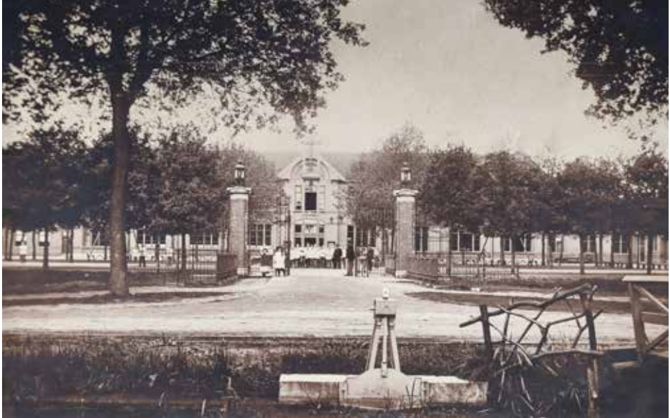
Het rijksopvoedingsgesticht Veldzicht.

Niets op Veldzicht laat zo duidelijk de wisselwerking tussen het rijksopvoedingsgesticht en de buitenwereld zien als het hek.