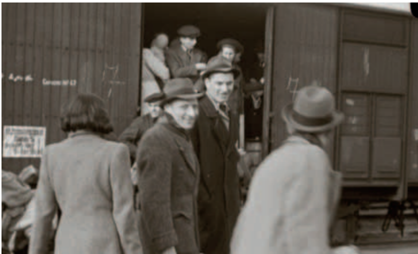
Beeld uit de Westerbork-film van kampbewoners op weg naar de transporttrein, 19 mei 1944.

De ironie van de geschiedenis wil dat Presser voor wat betreft het terrein van kamp Westerbork gelijk heeft gekregen: de barakken werden gesloopt en alleen het dadererfgoed is bewaard gebleven in de woning van de